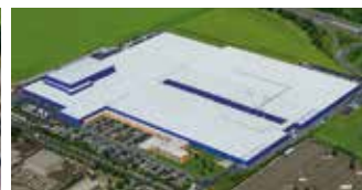
Hörmann KG Ichtershausen, Allemagne