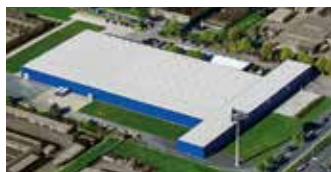
Hörmann KG Dissen, Allemagne