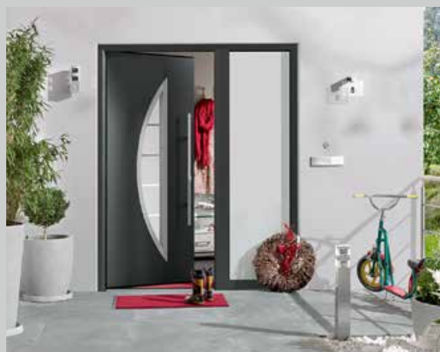
Porte d'entrée Thermo65 / Thermo46