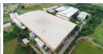
Shakti Hörmann Pvt. Ltd., Inde

En tant que seul fabricant complet sur le marché international, le groupe Hörmann propose une large gamme d'éléments de construction, provenant d'une seule source. Ils sont fabriqués dans des usines spécialisées suivant les procédés de fabrication à la pointe de la technique. Grâce au réseau européen de vente et de service, orienté vers le client et la présence sur le marché aux Etats-Unis et en Asie, Hörmann se positionne comme votre partenaire international performant pour tous les éléments de construction. Hörmann, l'assurance de la qualité.