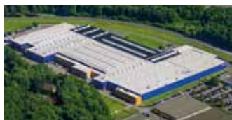
Hörmann KG Eckelhausen, Allemagne