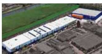
Hörmann Alkmaar B.V., Pays-Bas