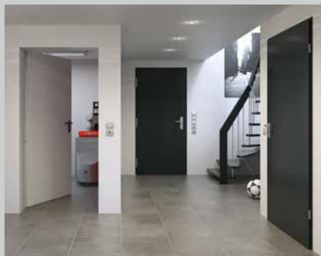
Portes en acier