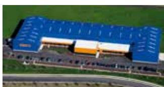
Hörmann Flexon LLC, Burgettstown PA, USA