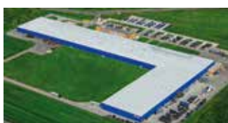
Hörmann Legnica Sp. z o.o., Pologne