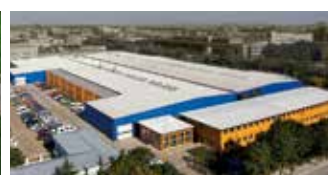
Hörmann Beijing, Chine