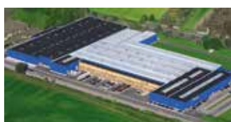
Hörmann KG Werne, Allemagne