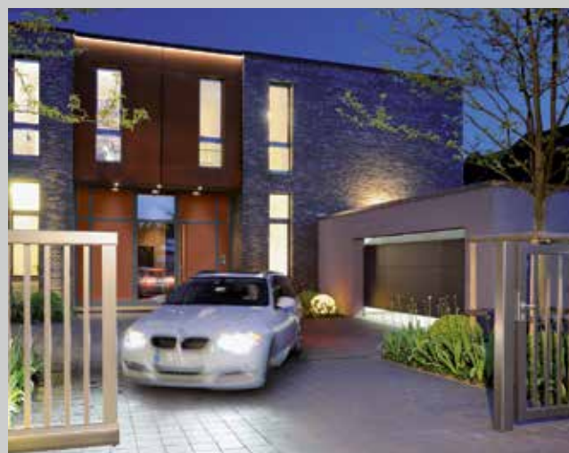
Portes de garage et motorisations

Choisissez un modèle dans notre large éventail de produits pour la construction, l'agrandissement et la rénovation.