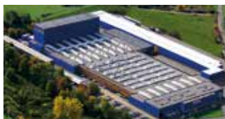
Hörmann KG Freisen, Allemagne