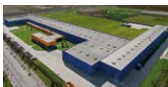
Hörmann Tianjin, Chine